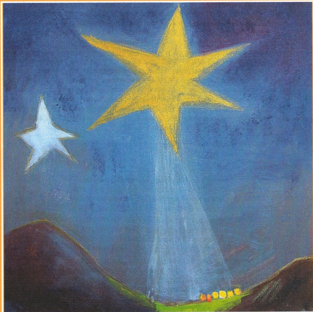
Ein Stern leuchtet auf Dietlinde Assmus, Ölmalerei, www.neuestadt.com

Pfarrereingemeinschaft Bodenwöhr / Alten- und Neuenschwand Nr. 21 / 2015 vom 19. 12. – 10. 01. 2016 (= 3 Wochen)