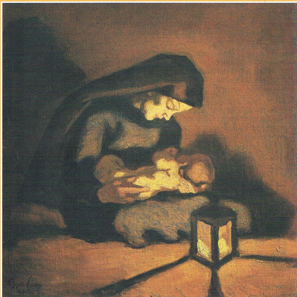
Albin Egger-Lienz, Madonna mit Kind, 1921

Pfarreiengemeinschaft Bodenwöhr / Alten- und Neuenschwand Nr. 23 / 2014 vom 20. 12. – 11. 01. 2015 (= 3 Wochen!)